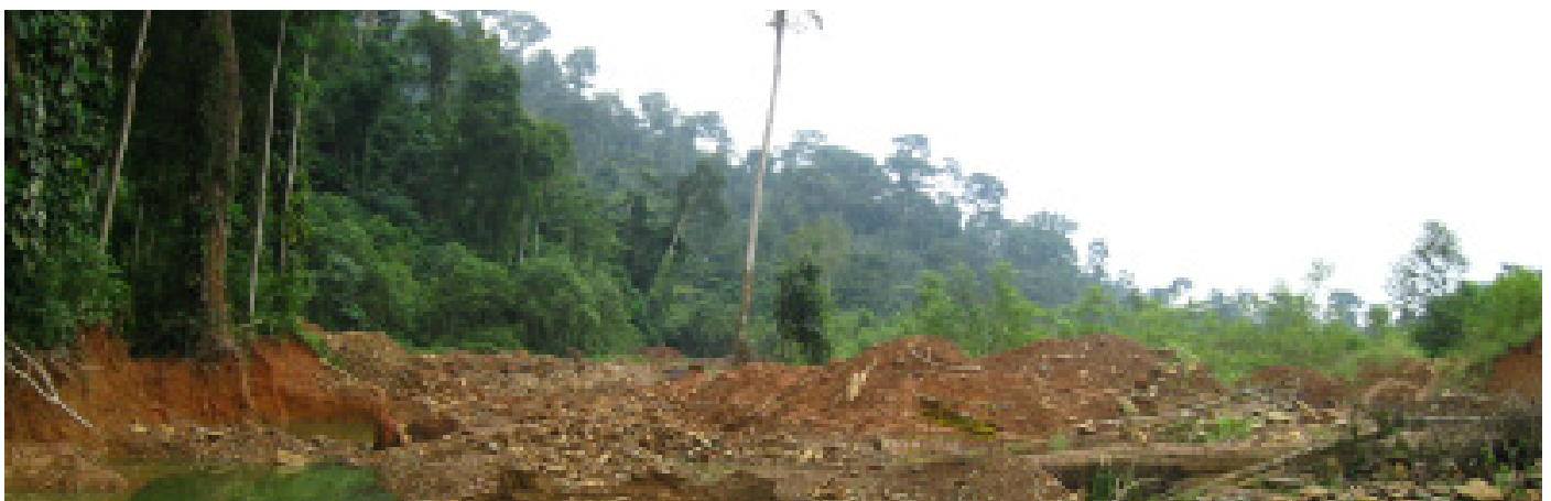
Destrucción forestal por galamsey (minería de oro informal) en la Reserva Forestal Atewa Range, Ghana.